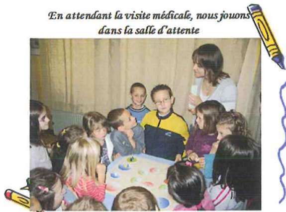
En attendant la visite médicale, nous jouons dans la salle d'attente